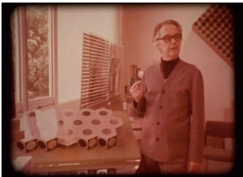
Victor Vasarely devant la maquette du Centre architectonique (1972)

« La Fondation ou plus exactement le Centre architectonique d'Aix, dans un certain sens, est le prolongement logique du Musée didactique. Là se trouvent énoncées, en théorie mais aussi en pratique, les conceptions plastiques auxquelles je crois »