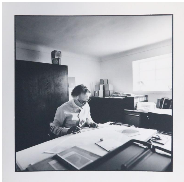
Vasarely dans son atelier de Gordes (circa 1970)

La Fondation Vasarely reconnue d'utilité publique en 1971, vient de recevoir le 10 décembre 2020 l'appellation « Musée de France ».