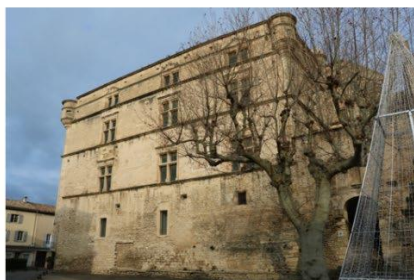
Musée didactique de Gordes