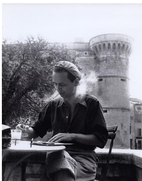
Victor Vasarely devant le château de Gordes en 1948.

10 novembre 2021- 8 mai 2022, Fondation Vasarely : L'art sera trésor commun ou ne sera pas