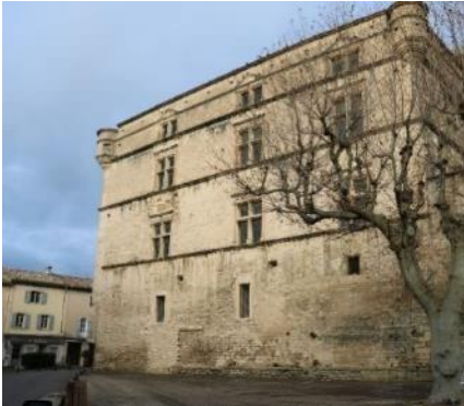
Figure 1: Vue du château ©Fondation Vasarely