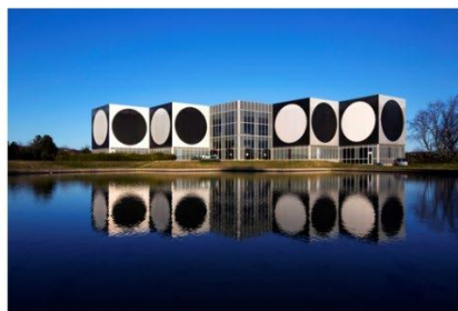
Centre architectural d'Aix-en-Provence