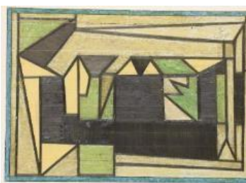
Œuvre Magnitogorsk, dessin, 28,7 x 39,9 cm, 1948. Fondation Vasarely.

Une section de l'exposition sera consacrée à la présentation d'un aspect plus personnel de la vie de l'artiste et de son atelier des « Devens » à Gordes, partie intégrante du Projet Scientifique et Culturel de la Fondation Vasarely avec la création d'un parcours consacré au plasticien au travers de ses trois grands lieux de création (Annet-Sur-Marne, Gordes et Aix-en-Provence).